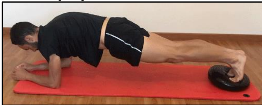
Planche dynamique sur une jambe.